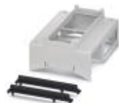
Boîtier sur profilé pour ordinateurs Raspberry Pi (convient pour Raspberry Pi A+, B+, B2, B3) ; jeu composé d'une partie supérieure et d'un support de circuit imprimé ; boîtier suivant DIN 43880

Boîtier électronique - RPI-BC 107,6 DEV-KIT KMGY P10 - 2202875