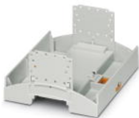
Boîtiers fermés pour installations, Partie inférieure, largeur: 107,6 mm, coloris: gris clair (7035)

Remarque : les données indiquées ici sont tirées du catalogue en ligne. Vous trouverez toutes les informations et données dans la documentation utilisateur. Les conditions générales d'utilisation pour les téléchargements sur Internet sont applicables. ( http://phoenixcontact.fr/download )