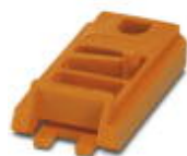
Boîtier fermé, coloris: orange

Pied de verrouillage - FUSSRIEGEL 14,4 L30 SPERR OG - 2896998