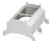
Boîtiers fermés pour installations, Partie supérieure, largeur: 107,6 mm, connexion transversale: Boîtiers, coloris: gris clair (7035)

Capot de boîtier - BC 107,6 OT U11 KMGY - 2896076