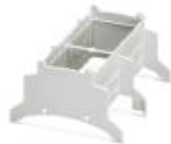
Boîtiers fermés pour installations, Partie supérieure, largeur: 107,6 mm, coloris: gris clair (7035)

Capot de boîtier - BC 107,6 OT U22 KMGY - 2896089