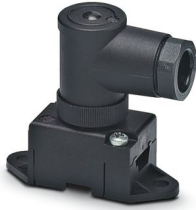
AS-Interface Verteiler in Schutzart IP67 für 1 Flachleitung, 2-polig, mit Schraubanschluss, gewinkelt

Bitte beachten Sie, dass die in diesem PDF-Dokument angezeigten Daten aus unserem Online-Katalog generiert wurden. Bitte finden Sie die vollständigen Daten in der Benutzer-Dokumentation. Es gelten unsere Allgemeinen Nutzungsbedingungen für Downloads.