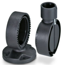
折叠式基座，间距7.5°，黑色

请注意，本PDF文档中所示数据均生成自在线目录。完整数据请见用户文档。我们的一般下载使用条款已生效。