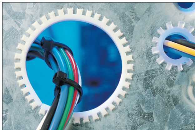
Optimale bescherming van kabels en leidingen langs scherpe randen.