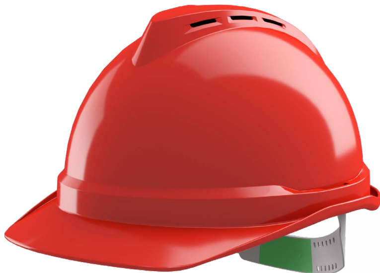
V-Gard 500 ventilé Push-Key