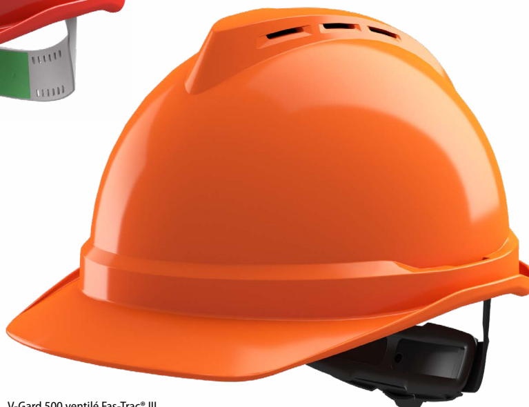
V-Gard 500 ventilé Fas-Trac® III