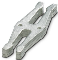
连接CAPAROC初始汇流条的金属延长轨。

请注意，本PDF文档中所示数据均生成自在线目录。完整数据请见用户文档。我们的一般下载使用条款已生效。