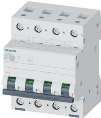
Leitungsschutzschalter 400V 6kA, 4-polig, B, 40A