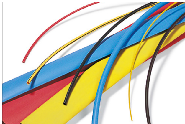
TF21 - disponible dans une large gamme de couleurs et dimensions.

Pour plus d'informations sur les générateurs d'air chaud, voir page 317/318.