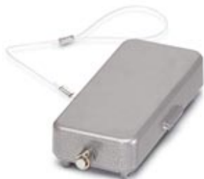
HEAVYCON保護カバー、タイプB16、シングルロッキングラッチ付きベースエレメント用、押さえコード付き、IP65、ALU

このPDF文書に表示されているデータはフェニックス・コンタクトのオンラインカタログから作成したものです。全データはユーザーマニュアルに記載されています。ダウンロードの規定は有効です ( http://phoenixcontact.jp/download )