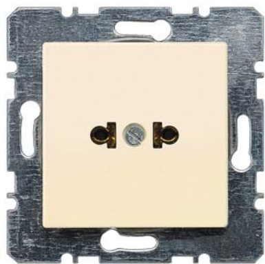
DELTA i-system elektroweiß SCHUKO 15A 125V amerik. Standard C73 51x 51mm