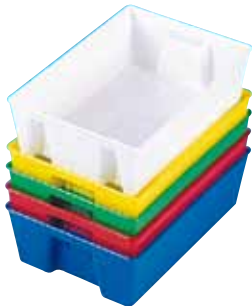
réf. PL-C code 3922 + coloris dim int. L x l x H : 190 x 120 x 50 mm • encastrables et empilables par retournement • rouge, vert, jaune, blanc, bleu