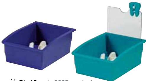
réf. PL-18 code 3925 + coloris dim. int. L x l x H : 126 x 178 x 79 mm • rouge, vert, jaune, blanc, bleu, noir, orange

En polystyrène choc, ces plateaux sont très appréciés par les laboratoires du secteur dentaire et notamment par les prothésistes.