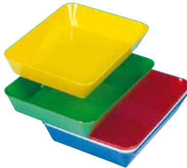
réf. PL-B code 3920x + coloris dim. int. du fond L x l x H : 210 x 150 x 40 mm dim ext. L x l x H : 260 x 196 x 42 mm • encastrables • rouge, vert, jaune, blanc, bleu