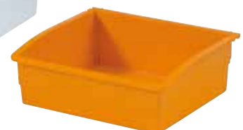
réf. PL-16 code 3924 + coloris dim. int. L x l x H : 208 x 178 x 79 mm • rouge, vert, jaune, blanc, bleu, noir, orange