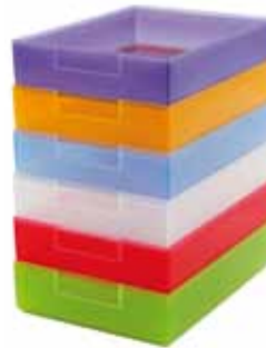
réf. PLATEAUX-PENICHES code 2650x + coloris dim int. L x l x H : 230 x 158 x 48 mm dim ext. L x l x H : 240 x 167 x 52 mm • empilables • rose, vert, orange, blanc, bleu, violet