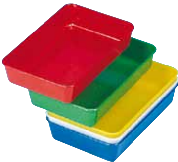
réf. PL-A code 3910x + coloris dim. int. du fond L x l x H : 175 x 100 x 34 mm dim ext. L x l x H : 205 x 130 x 37 mm • encastrables • rouge, vert, jaune, blanc, bleu