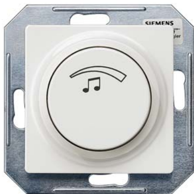
DELTA i-system titanweiß Lautstärkeregler mono, 3 Watt 27 Ohm