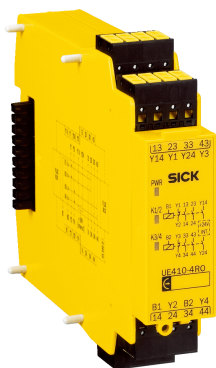
图片可能存在偏差