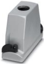
HEAVYCON ADVANCE EMVスリーブハウジングB24、バヨネット式、高さ100 mm、1x M40ネジ付き、ストレートケーブル挿入口

このPDF文書に表示されているデータはフェニックス・コンタクトのオンラインカタログから作成したものです。全データはユーザーマニュアルに記載されています。ダウンロードの規定は有効です ( http://phoenixcontact.jp/download )