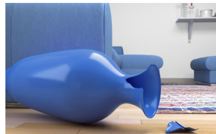
Riparazione di oggetti.