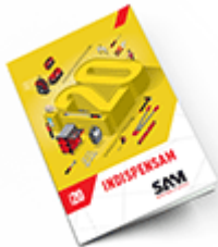
Les outils Indispensables SAM 2020

Découvrez tous nos produits dans nos catalogues en ligne