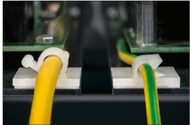
Befestigungssockel selbstklebend RA6 (l) und RB5 (r).