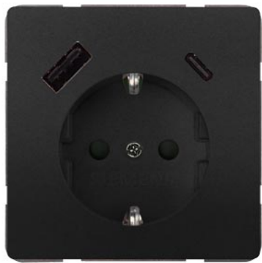
DELTA style anthrazit USB-SCHUKO-Steckdose 2 USB A+C Leistung: bis zu 18 W