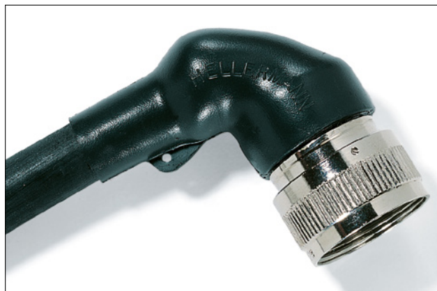
1152-4-G montée sur connecteur.