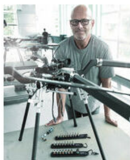
Les sangles porte-outils Wera