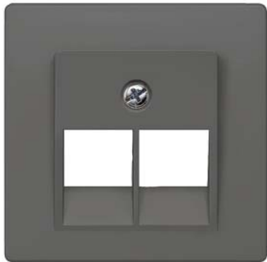
DELTA i-system carbonmetallic Abdeckung UAE-Kat.3, 2-fach 55x55mm