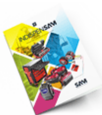
Les outils Indispensables 2021

Découvrez tous nos produits dans nos catalogues en ligne