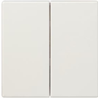
DELTA style titanweiß Wippe 2-fach neutral 68x68mm