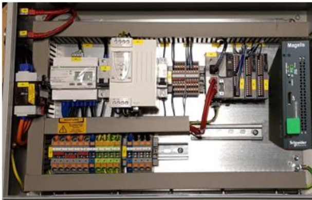
GreenBox Sensor Power