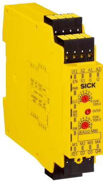
Afbeelding kan afwijken