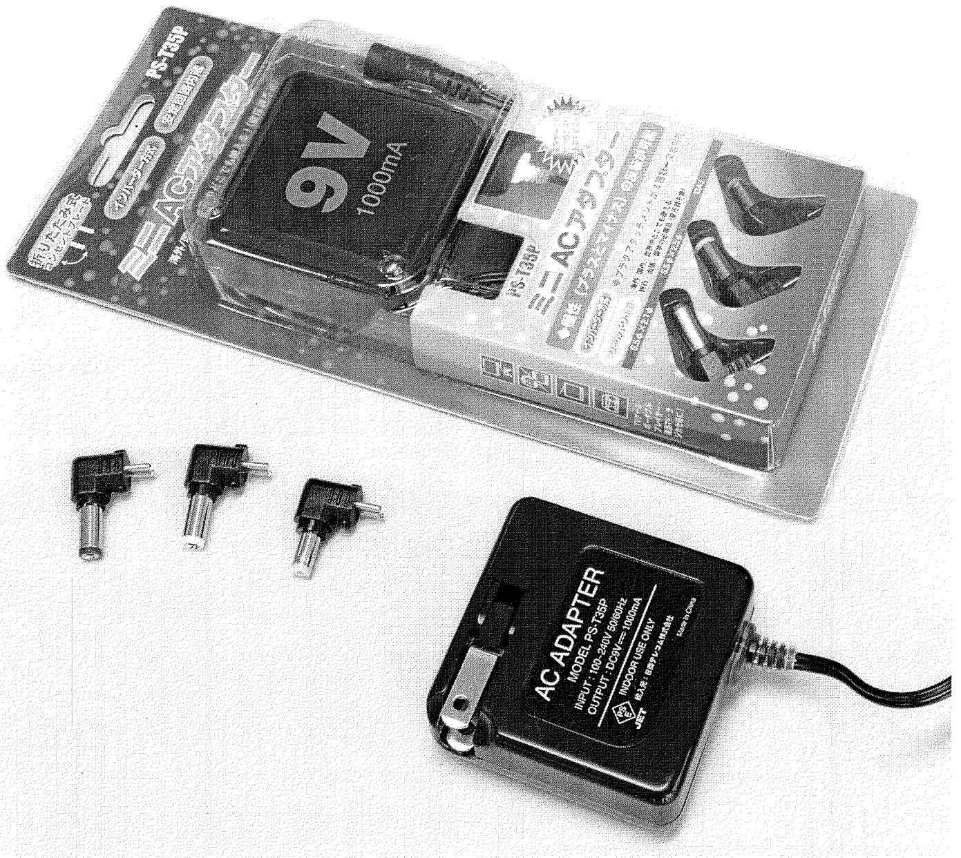
PS-T35Pシリーズ ブリスターパック