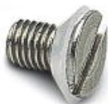
シーリングネジ、IP65保護用