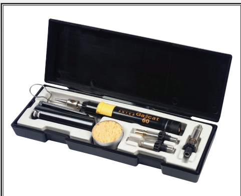
Boîte à outils gaz