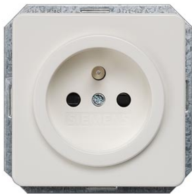
DELTA i-system SCHUKO titanweiß mit Mittenschutzkontakt Kinderschutz, 2-pol nach CEE 7 65x65mm