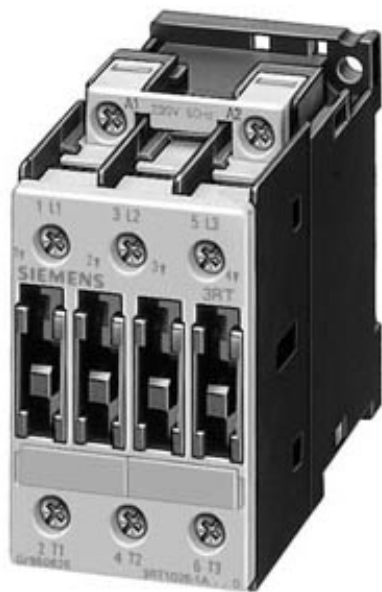
CONTACTOR, AC-3 7.5 KW/400 V, DC 24 V, 3-POLE, SIZE S0, SCREW CONNECTION