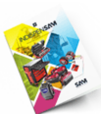
Les outils Indispensables 2021

Découvrez tous nos produits dans nos catalogues en ligne