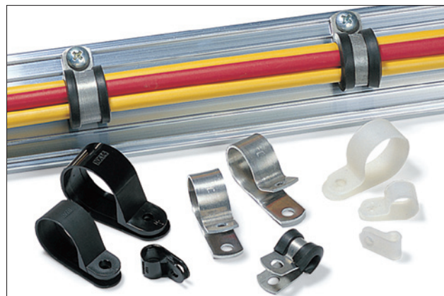
P-clips vervaardigd uit polyamide, aluminium of aluminium met een chloropreen-profiel.