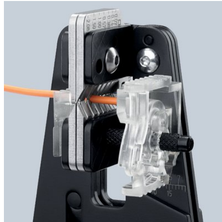
Dénudage suivant la forme du câble grâce aux profils coupants de précision