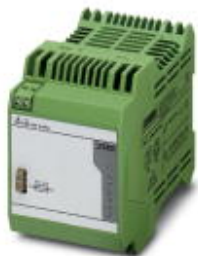
Energiespeicher, Blei-AGM, VRLA-Technologie, 24 V DC, 0,8 Ah.

Bitte beachten Sie, dass die hier angegebenen Daten dem Online-Katalog entnommen sind. Die vollständigen Informationen und Daten entnehmen Sie bitte der Anwenderdokumentation. Es gelten die Allgemeinen Nutzungsbedingungen für Internet-Downloads. ( http://phoenixcontact.de/download )