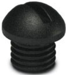
M5-Verschlusschraube für nicht belegte M5-Buchsen der Sensor-/Aktor-Kabel, Boxen und Einbausteckverbinder

Bitte beachten Sie, dass die hier angegebenen Daten dem Online-Katalog entnommen sind. Die vollständigen Informationen und Daten entnehmen Sie bitte der Anwenderdokumentation. Es gelten die Allgemeinen Nutzungsbedingungen für Internet-Downloads. ( http://phoenixcontact.de/download )