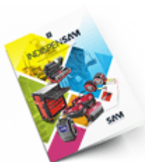
Les outils Indispensables 2021

Découvrez tous nos produits dans nos catalogues en ligne