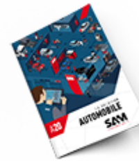
Automobile SAM 2020