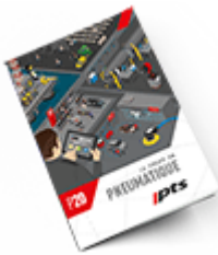
Pneumatique SAM 2020