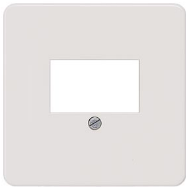
DELTA profil silber Abdeckplatte für TAE-Anschlussdose und Lautsprecher-Anschlussdose 65x 65mm