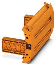
保护插头， 位数: 9， 颜色: 橙色

请注意，本PDF文档中所示数据均生成自在线目录。完整数据请见用户文档。我们的一般下载使用条款已生效。