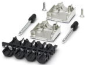
POWER-SUBCONケーブルハウジング、3極

このPDF文書に表示されているデータはフェニックス・コンタクトのオンラインカタログから作成したものです。全データはユーザーマニュアルに記載されています。ダウンロードの規定は有効です ( http://phoenixcontact.jp/download )