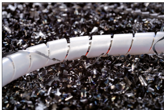
Spiralslange SBPA gir god vibrasjonsbeskyttelse.

Spiralslange i flammehemmende polyamid 6 finner du i vår Industriekatalog.