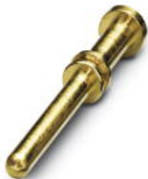
压接插针，车削，触点直径: 2 mm，压接范围: 0.75 mm 2 ... 1.5 mm 2

Please be informed that the data shown in this PDF Document is generated from our Online Catalog. Please find the complete data in the user's documentation. Our General Terms of Use for Downloads are valid ( http://download.phoenixcontact.com )