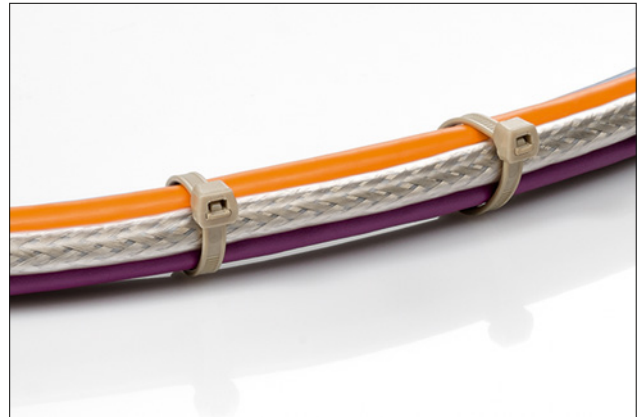
Colliers en PEEK en application.

Pour plus d'informations sur les matériaux, voir page 24.