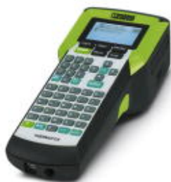
Stampante a trasferimento termico portatile per materiali in rotolo

Si ricorda che i dati qui indicati sono estrapolati dal catalogo online. Per informazioni e dati dettagliati, consultare la documentazione per l'utente. Si intendono applicate le Condizioni di utilizzo generali per i download da Internet. ( http://phoenixcontact.it/download )