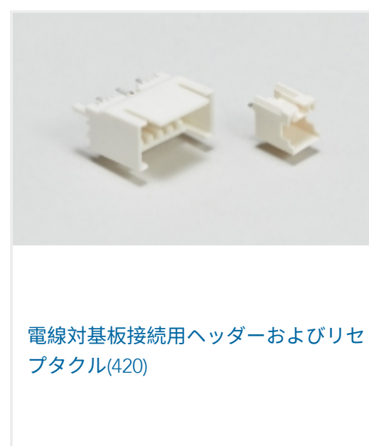
電線対基板接続用ヘッダーおよびリセブタクル(420)