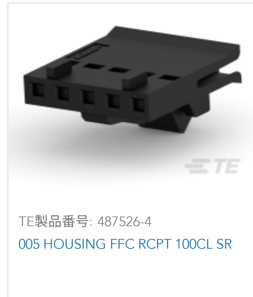
TE製品番号: 487526-4 005 HOUSING FFC RCPT 100CL SR