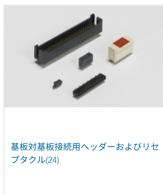
基板対基板接続用ヘッダーおよびリセブタクル(24)