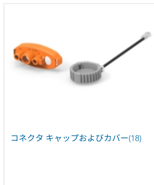
コネクタ キャップおよびカバー(18)