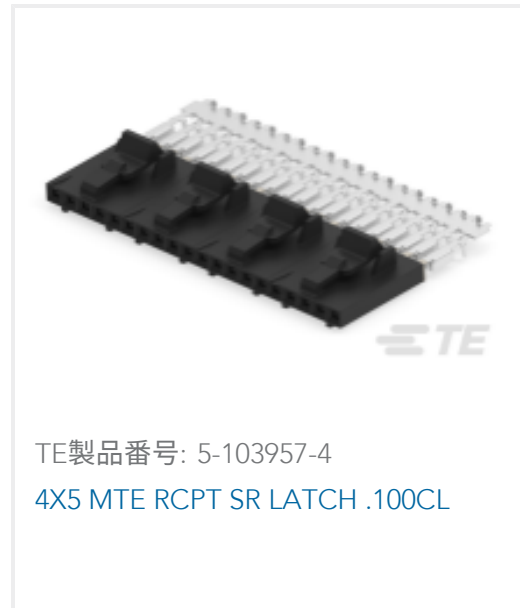
TE製品番号: 5-103957-4 4X5 MTE RCPT SR LATCH .100CL