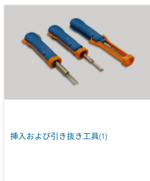
挿入および引き抜き工具(1)