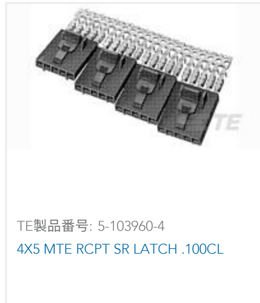
TE製品番号: 5-103960-4 4X5 MTE RCPT SR LATCH .100CL