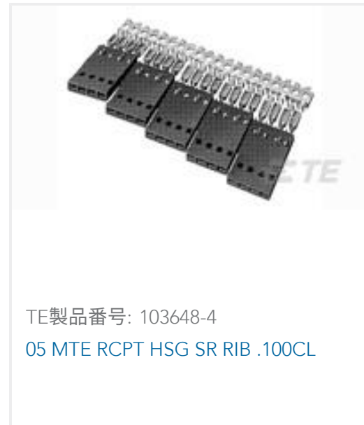
TE製品番号: 103648-4 05 MTE RCPT HSG SR RIB .100CL