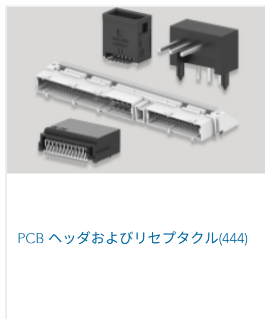
PCB ヘッダおよびリセブタクル(444)