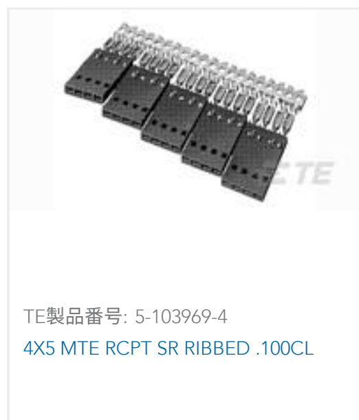
TE製品番号: 5-103969-4 4X5 MTE RCPT SR RIBBED .100CL