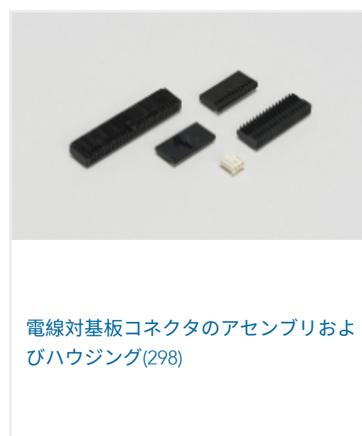
電線対基板コネクタのアセンブリおよびハウジング(298)