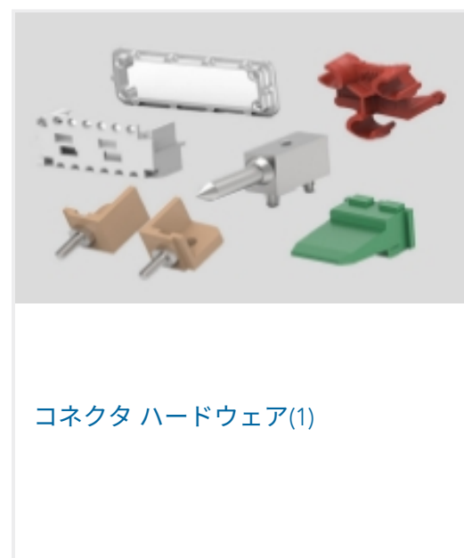
コネクタ ハードウェア(1)